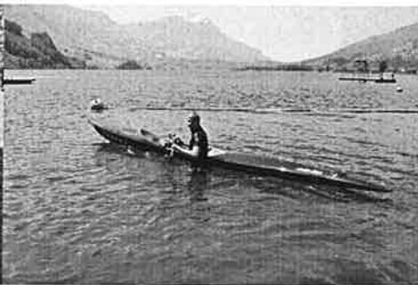
Surf Ski Race

Neben den Disziplinen im Schwimmbecken gilt es auch, unsere Fähigkeiten am Strand und im Meer unter Beweis zu stellen. Dies zum Teil mit sehr komisch aussehenden Rettungsgeräten, wie den „Surf Ski“ oder das „Board“. Da für uns die Entfernung zum Meer doch beträchtlich ist, dienten die Aare und der Lauerzersee sowie diverse Volleyballfelder als Trainingsgelände.